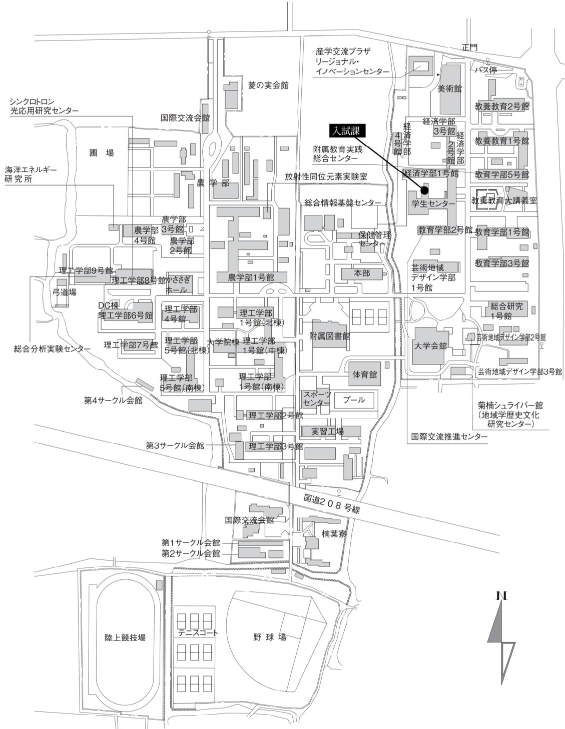
佐賀大学（本庄キャンパス）建物配置図