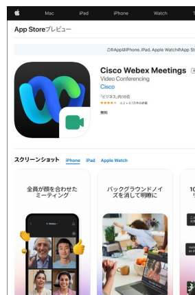
※画像はApp Storeの画面です