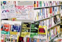
専門書・就活書の品揃え(学生会館)