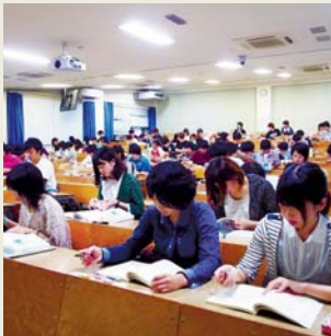
公務員試験対策講座

学内実施の公務員試験対策講座、教員試験対策講座、TOEIC入門講座などで佐賀大生の学びとキャリア、成長をサポートします。先輩が後輩をアドバイスするサポーター制度も確立しています。