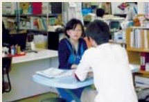
講座担当職員による面談